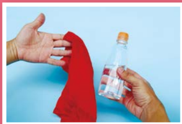
8. 左手到口袋或抽屜拿出絲巾時，同時棄置手中的瓶蓋於口袋內。