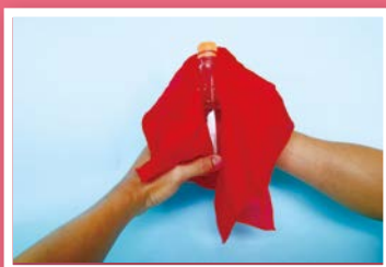
9. 將絲巾包覆瓶裝水，用力搖一搖。