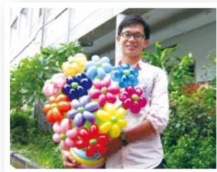
文 / 龍安國小 廖丁民 老師