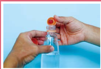
7. 將染色瓶蓋蓋住瓶裝水鎖緊。