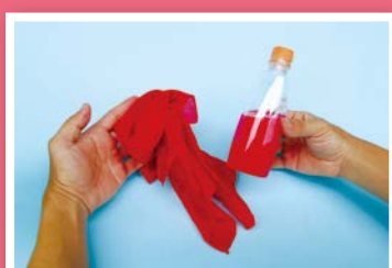
10. 翻開絲巾，瓶裝水神奇的變色了。