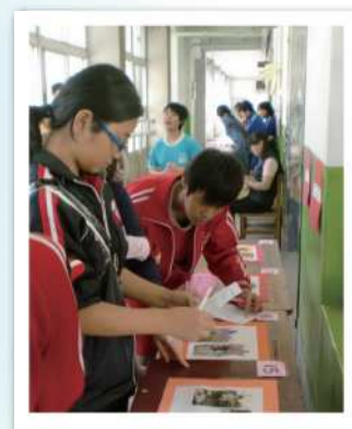
校慶活動- 那些年，老師們也和你們一樣在學習中長大

離去時，廊上走動的學生，衣著整齊，微笑向老師問好，師生間的互動關懷，像溫暖的陽光灑在廊道間。