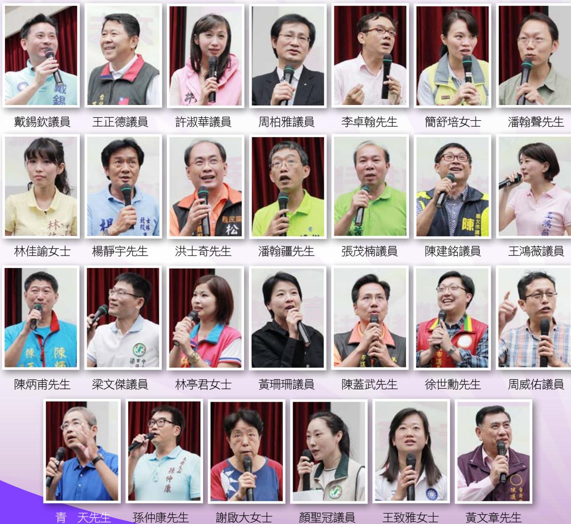
◎出席本次活動的台北市議員候選人（依報到順序）

教師是翻轉教育契機的推手，臺北市教師會呼籲社會應重視教育第一線工作者的聲音，以專業的態度描繪孩子們的教育藍圖，共同為孩子打造美好的教育環境，也期待候選人當選後，不要忘記了今天的教育愛心與承諾。