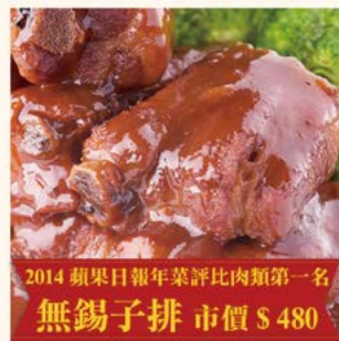
2014 蘋果日報年菜評比肉類第一名 無錫子排 市價 $ 480