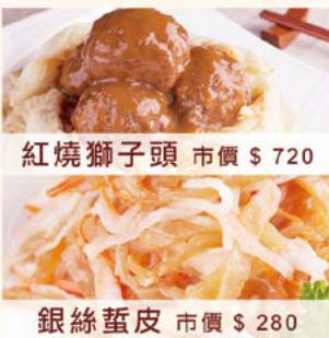
紅燒獅子頭 市價 $ 720