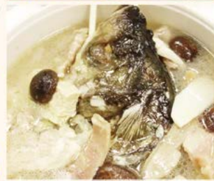
白燒砂鍋魚頭 市價 $ 1080