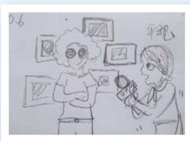
分鏡表與拍攝畫面

影片完成之後，團隊並製作出教學用 DVD，發送給參與研習的教師，內容包括正片播放（全片約 30 分鐘）、新聞完整專訪可作影片導讀、夢想 MV（主題曲：手心裡夢想～慢半拍樂團）、幕後訪談 1：夢想是什麼、幕後訪談 2：拍片的感想、17 歲的夢想（校園採訪十七歲學生談夢想）。並邀請各科老師為這部微電影設計相關的學習單，例如生命教育、生涯規劃學習單、電影藝術學習單（可供美術、表演藝術、藝術生活、生活科技等相關課程使用）、夢想學習單（可供國文、電影鑑賞、觀影心得等相關課程規畫使用），並實際運用於課堂，觀察學生學習成效，作為未來繼續努力的目標。