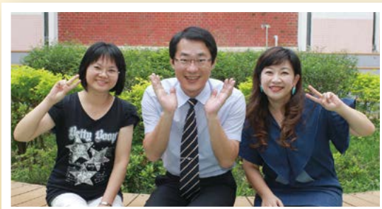
◎教師會長 校長 家長會長