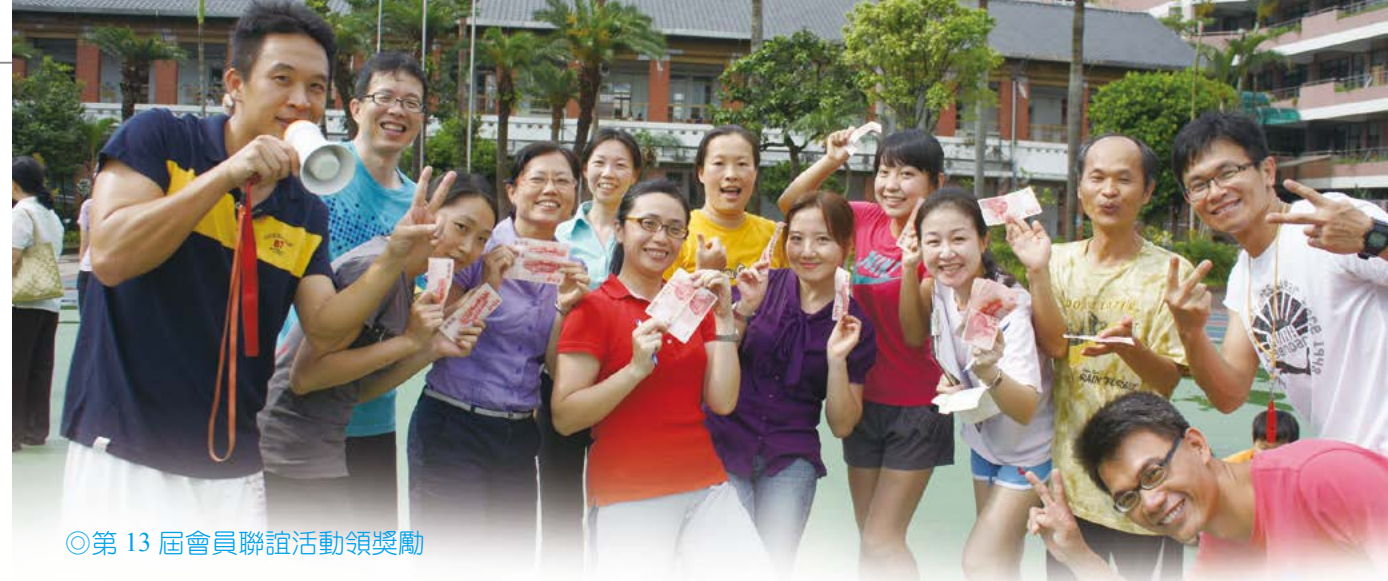
◎第 13 屆會員聯誼活動領獎勳

望，這只有擔任過理事長的才能體會。雖然有很堅強的團隊夥伴，但崩潰的那瞬間，還是只有自己一人；但是想起需要幫助的會員老師，就會繼續思考解決辦法並且執行。也許不是每件事盡如人意，但是至少問心無愧。