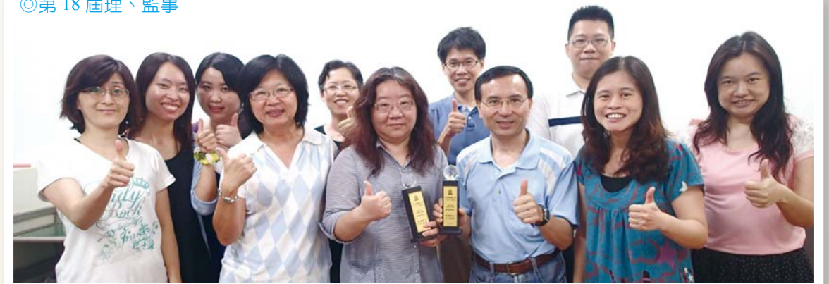
◎第 18 屆理、監事

102 年度本會特別將眾所期待的「冬至湯圓摸彩聯歡會」，延到校務評鑑過後舉辦，在歲末慰勞全體教職員工的辛勞，注入大大滿溢的溫暖。並特別邀請到已退休多年的客家湯圓