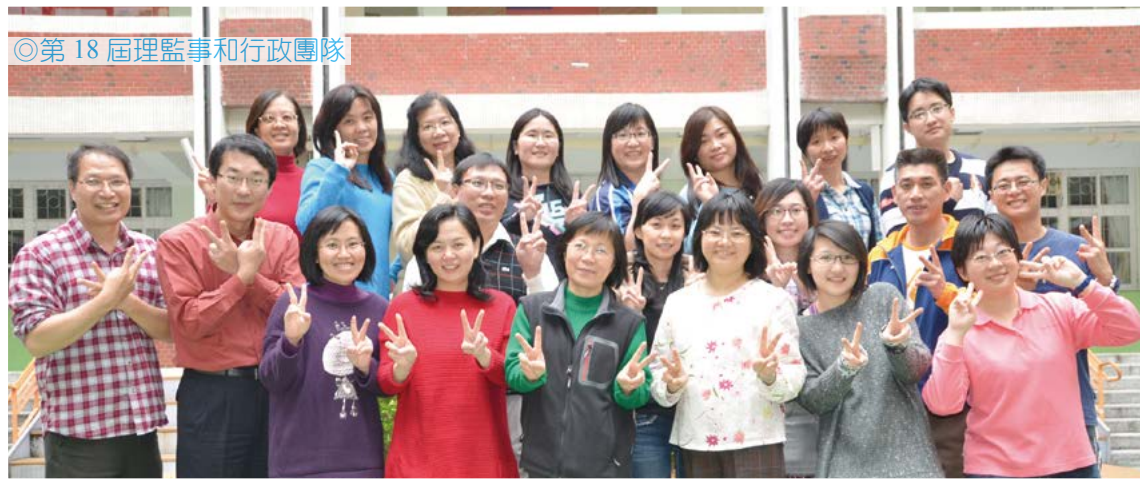
◎第 18 屆理監事和行政團隊

在校長和同仁的肯定推舉下，我有幸的連任麗山國中教師會會長兩年，當初心情惶恐不安，一路走來兢兢業業，到今日即將卸任，情緒坦然而淡定。感恩大家給我這一個磨練的機會。其實只要秉持真誠待人、珍愛麗山的原則，任何問題都可迎刃而解的。所以誠摯希望同仁們可以嘗試接替會長的職務，勇於承擔責任，「會長」並沒有想像中的困難。