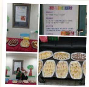
◎夢想 17 研習

但這件事情真的很困難，因為雙方都有各自的立場，如果又加上信任感不足，那就真的是費時費力了。還好，經由多次市教會辦理的會務研習，讓我們的能力不斷的增加。