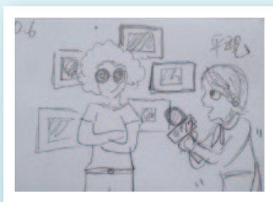
分鏡表與 拍攝畫面

影片完成之後，團隊並製作出教學用 DVD，發送給參與研習的教師，內容包括正片播放（全片約 30 分鐘）、新聞完整專訪可作影片導讀、夢想 MV（主題曲：手心裡夢想～慢半拍樂團）、幕後訪談 1：夢想是什麼、幕後訪談 2：拍片的感想、17 歲的夢想（校園採訪十七歲學生談夢想）。並邀請各科老師為這部微電影設計相關的學習單，例如生命教育、生涯規劃學習單、電影藝術學習單（可供美術、表演藝術、藝術生活、生活科技等相關課程使用）、夢想學習單（可供國文、電影鑑賞、觀影心得等相關課程規畫使用），並實際運用於課堂，觀察學生學習成效，作為未來繼續努力的目標。