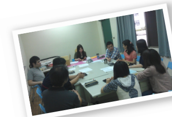
◎討論會務開會狀況

由於高中老師的共同時間比較少，為了吸引老師們參加教師會活動，辦理研習活動前，會先進行意見調查，確認老師們有興趣的主題；當敲定研習活動主題與時間後，會先傳通知單邀請老師們參加報名，方便事先統計人數；活動當日則會準備小點心和飲料，因此參與的人數大約都有30~40人。