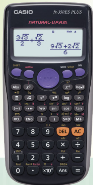
fx-350 ES PLUS