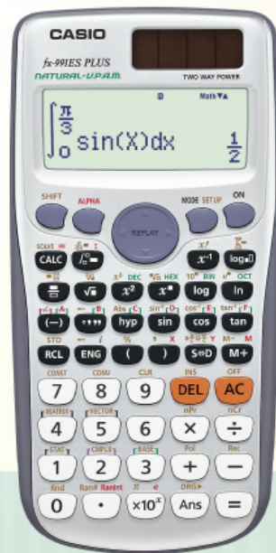
fx-991 ES PLUS