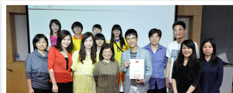
◎「跟著玩家旅遊趣」研習 ◎辦理研習、愛合購活動、湯圓大會聯絡情誼

高中教師的專業自主性與廣闊的校園，使得教師們彼此的教學環境不容易有交集，這一點也許會讓高中教師團體，在凝聚共識這方面的困難度較高，但我相信育成高中以兩位會長的熱情及行動力，必定能引起廣大迴響！