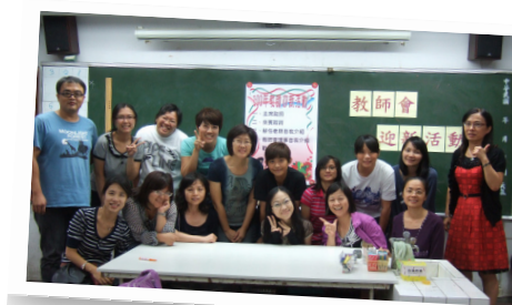
◎家長會長參與教師會迎新活動

學校的家長會是老師們的好幫手，親師合作愉快，家長也願意投入心力協助，例如：注音符號的補教教學，是由老師們先培訓志工家長，再利用兒童朝會時間請志工家長協助指導。週二教師晨會，會有生命愛爸或愛媽至各班進行生命教育課程，愛爸或愛媽們還會召開讀書會彼此分享與成長。