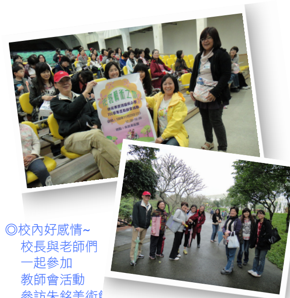
◎校內好感情~ 校長與老師們 一起參加 教師會活動 參訪朱銘美術館